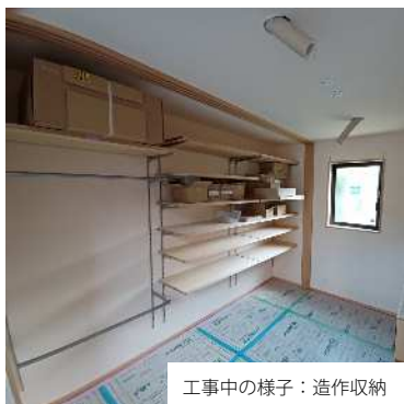
工事中的様子：造作収納

ご見学いただくお住まいは、ミドルエイジの家族づくりで理想的なご提案が随所にちりばめられています。自然素材をたっぷり使い、心地の良い空間に設えました。