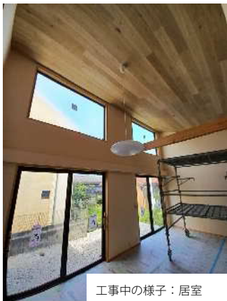
工事中的様子：居室

今回の建物は、長年この土地に住まわれたお施主様の家を建替えたものです。古い家への愛着や思い出を大切にしながらも、現代の快適さと機能性を兼ね備えた新しい住まいを実現したいと考えておられました。キリガヤもこのお施主様の想いを実現するために打ち合わせを重ね、設計士を交えながらご提案をしました。建替えをご検討の方にとって、とても参考になる見学会だと思います。