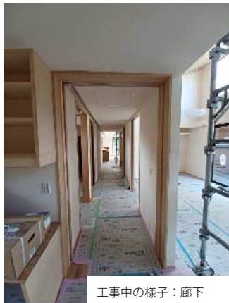
工事中的様子：廊下