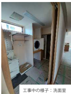
工事中的様子：洗面室